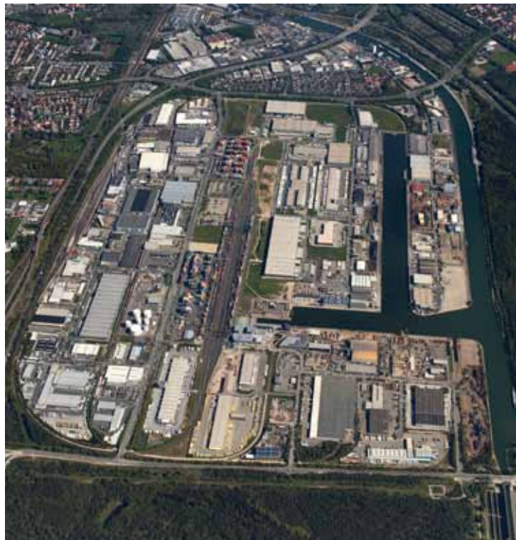
Stand: Mai 2017